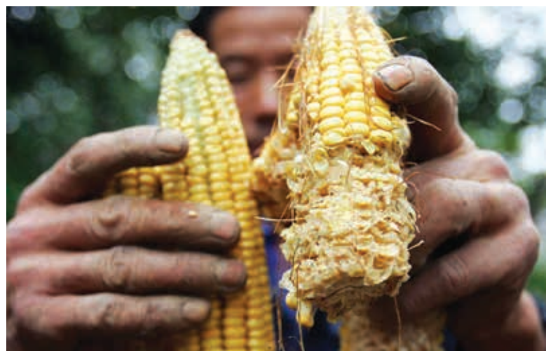
Na Serra Gaúcha, os principais problemas registrados pela espécie são nas lavouras de milho.

O manuseio de armas é de controle estrito do Exército Brasileiro e as informações para cadastramento podem ser obtidas no site da instituição ( www.dfpc.eb.mil.br ). O transporte de javalis capturados vivos não é permitido. A comercialização ou a doação desses produtos é proibida pela legislação sanitária e ambiental brasileira. Fonte: Ibama.