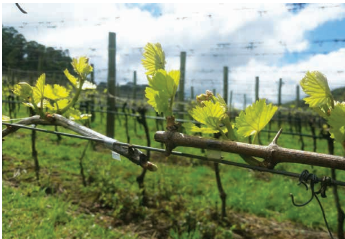
O fim do inverno se aproxima e surgem os primeiros brotos das videiras, trazendo a esperança de uma farta vindima. Capela São João, Flores da Cunha/RS