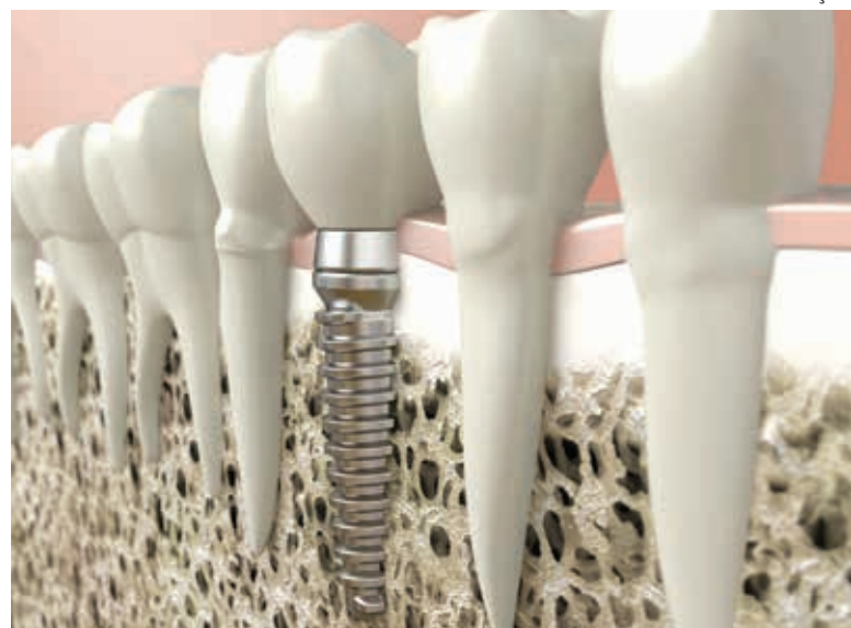
O implante dentário é um dos principais procedimentos realizados por agricultores, muitos por resultado de uma antiga odontologia agressiva.

Mas se apesar dessa rotina, você sentiu um desconforto, algumas características podem ajudar a identificar a dor. “Cárie simples normalmente não dói. Quando a lesão é mais profunda a dor ocorre na presença de estímulos como alimentos doces, frios ou quentes. No caso de cáries que atingem o