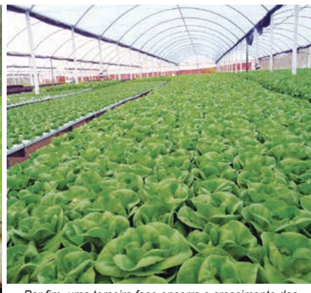
Por fim, uma terceira fase encerra o crescimento das hortaliças. Em meses mais frios, o ciclo completo demora em média 60 dias, período que cai pela metade no verão.