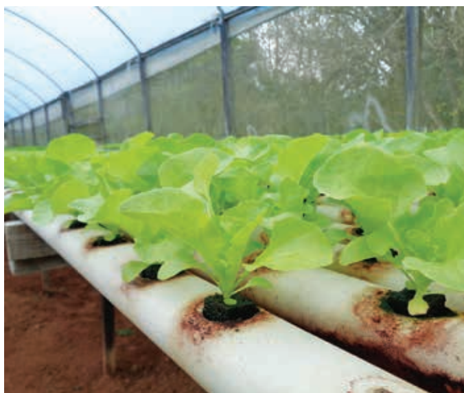
Em uma etapa seguinte, as hortaliças seguem para calhas maiores.