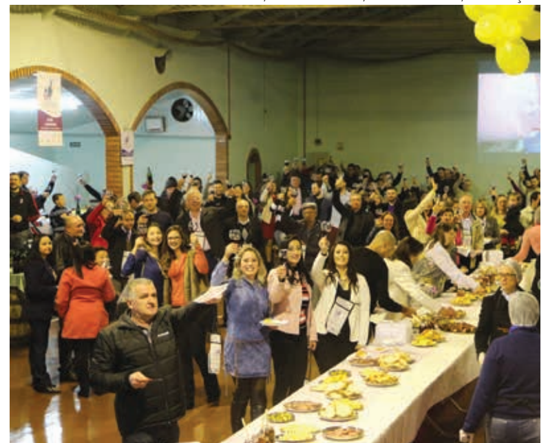
Evento reuniu mais de 600 pessoas na comunidade 8 da Graciema, no dia 3 de setembro.

Informações: Gilmar De Toni (54) 99442865 – Emater (54) 34522289