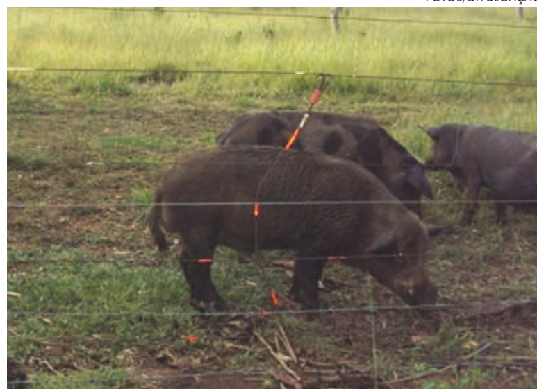
Somente no Rio Grande do Sul fala-se na presença de 500 mil javalis.

Nos países em que a espécie ocorre, seja nativa, como França, ou introduzida, como Estados Unidos e Austrália, a caça é autorizada. Nenhum país, no entanto, apresentou uma alternativa para a captura dos animais vivos. O alto grau de agressividade dos javalis asselvajados