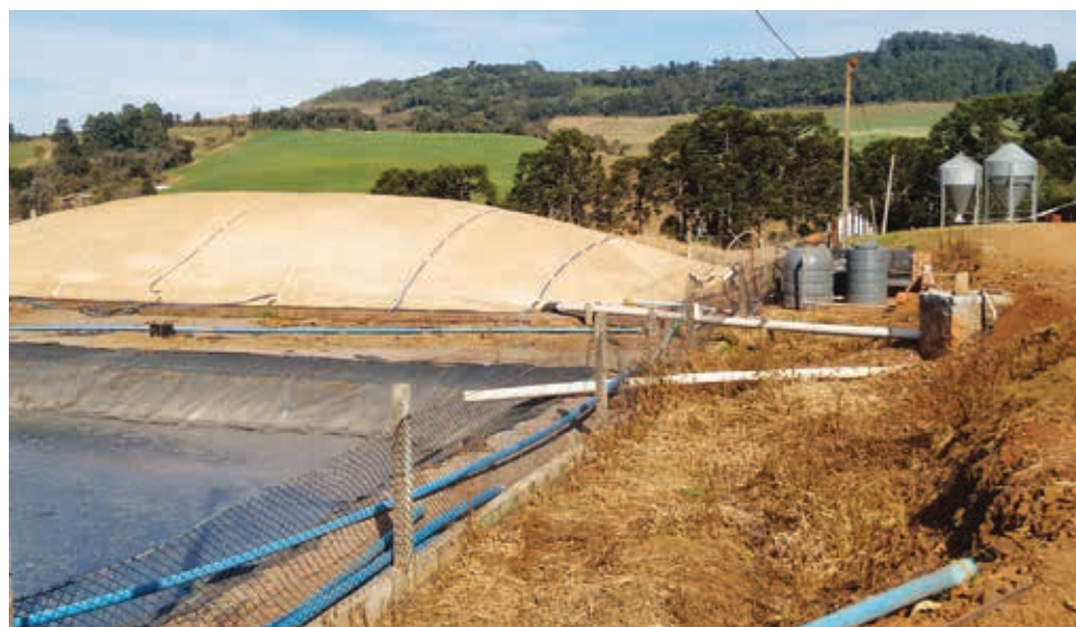
Biodigestor utiliza dejetos de suínos para a geração de biogás.

para aquecer os leitões. Nesse período, a nossa economia é de aproximadamente 50%. No próximo verão, quando estaremos com todos os biodigestores ligados ao gerador, esperamos chegar próximo de 100% de economia de energia elétrica, ou seja, nós estamos gerando essa energia ao invés de compra-la de uma concessionária”.