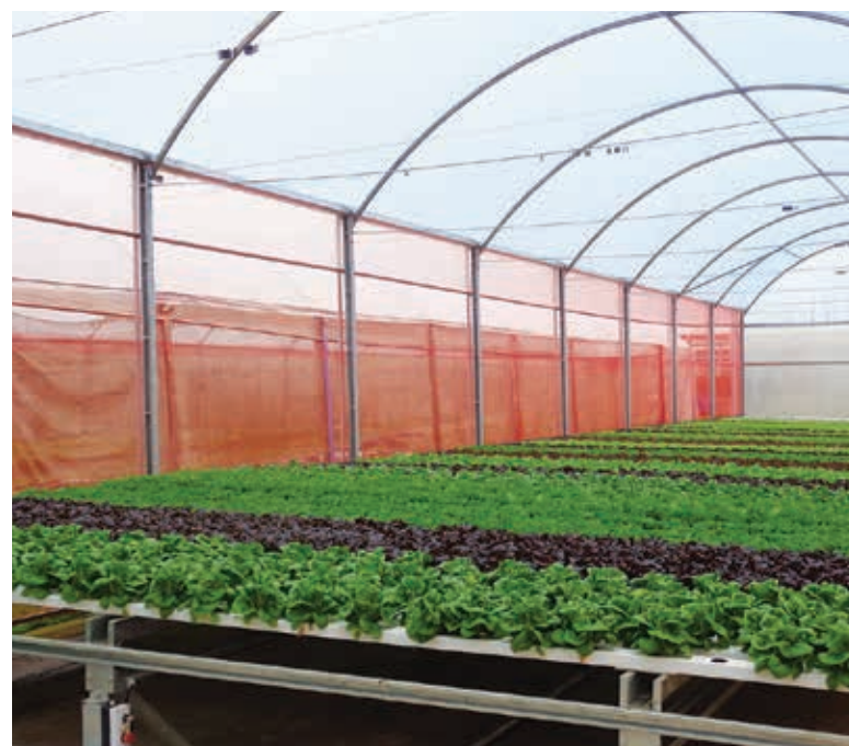
Estufas apresentam vida útil resistente, onde um sistema automático, que funciona como uma esteira, move as calhas das plantas diariamente.