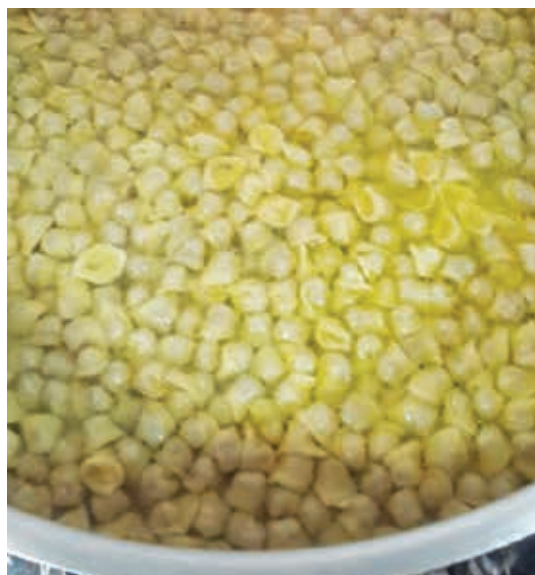
A deliciosa sopa de agnolini aquecendo o inverno na Serra Gaúcha. Flores da Cunha/RS