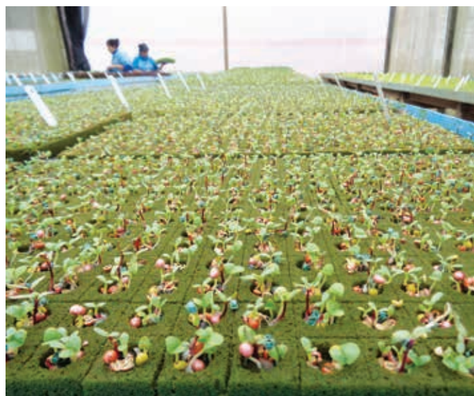
A primeira etapa da hidroponia é o berçário, onde as sementes germinadas começam a receber nutrientes.